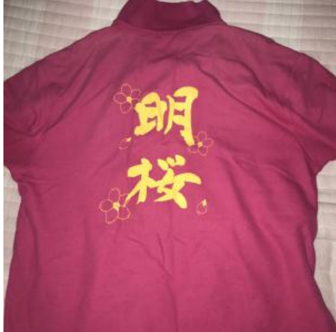
(穿过的最帅的衣服)