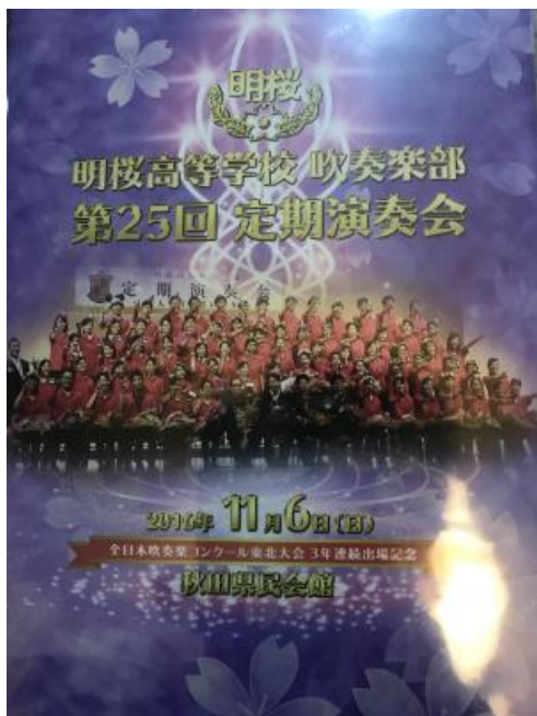
(还有这盘意义重大的CD)

之后，却万万没想到，马上就要迎来三年级前辈的引退。在前辈的引退仪式上，我也哭了，伴随着“きっと また会おう あの町で会おう 僕らの約束は消えはしない 群青の絆 また 会おう 群青の町で・・・”群青的歌声，我哭了，和大家一样。虽然只有短短的两个月，可是感觉他们是真的将我作一个后辈，一个弟弟来关心我，有他们，我也不孤单。