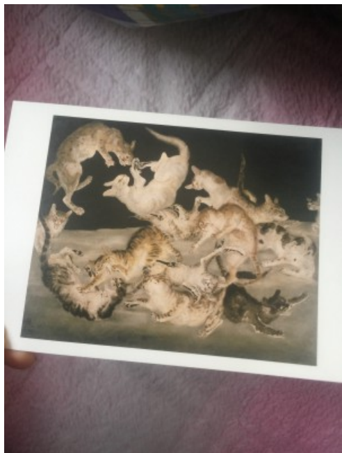
これは日本語で投稿されたものです